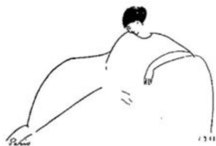
P. Modigliani: Anna Achmatova

Кроме стихов, писала Ахматова эссе, например, о Пушкине и других художниках слова.