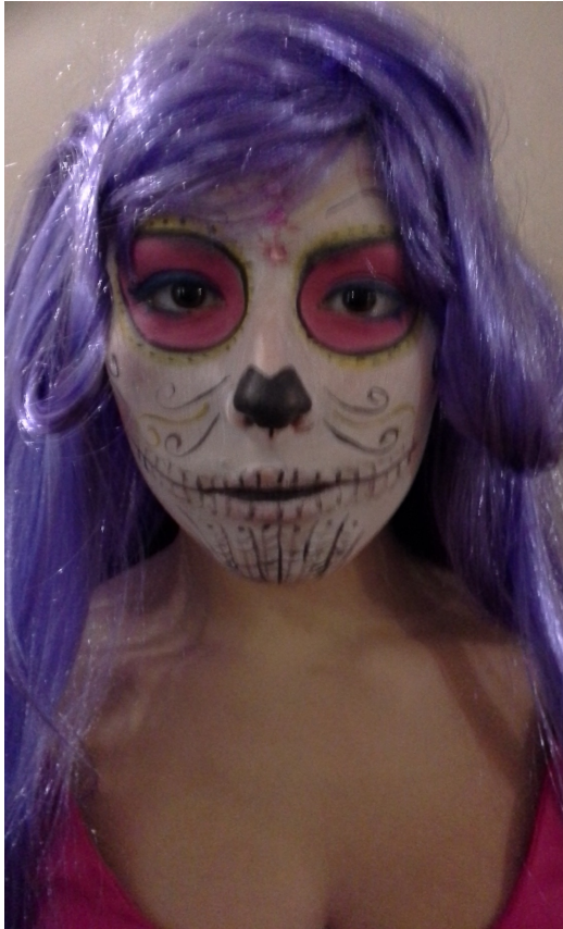
Тема Характерный грим