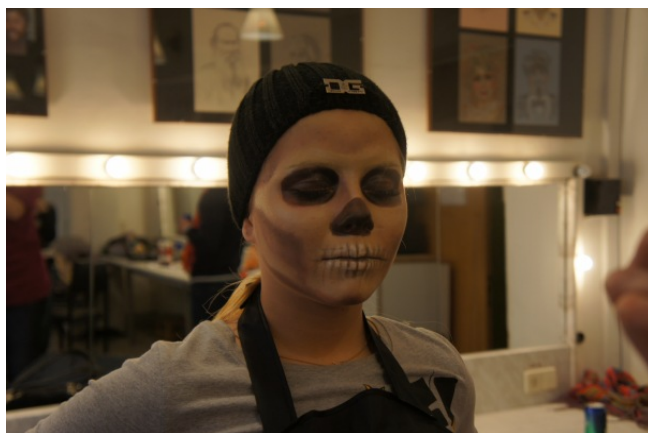
Фото материал. Тема. Череп