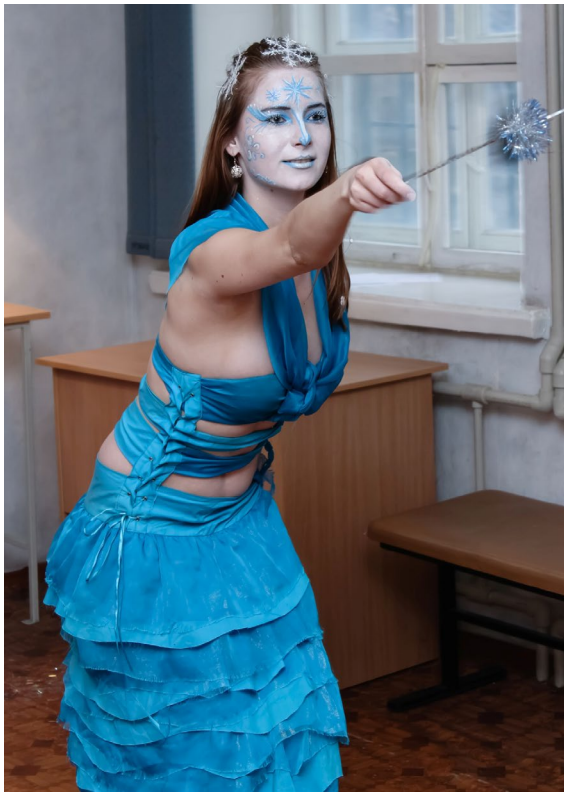
Тема. Грим зверей.