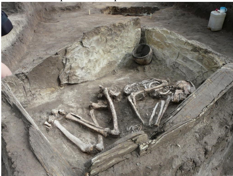
Захоронение человека периода бронзового века, Лисичанский район, 2013 г.

способа захоронения покойника под курганом и связаны с расселением в степях Юго-Восточной Европы индоевропейских племен.