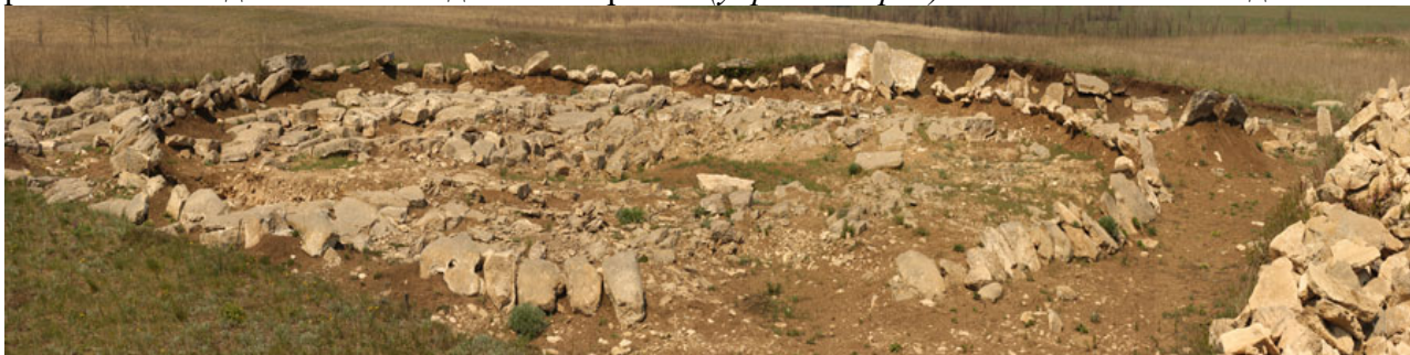
Кромлех «Мергелевая гряда», IV–II тыс. лет до н. э., с. Степановка Перевальского района

«Луганским стоунхенджем» называют курганный могильник « Мергелевая гряда », расположенный около с. Степановка Перевальского района. Строения комплекса, вероятно, функционировали как святилище и погребальное сооружение для различных племен этого региона от позднего неолита до эпохи бронзы ( убрать дефис ) со IV по II тыс. лет до н. э.