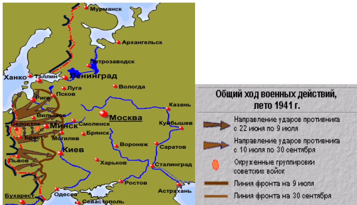
Группировка войск Германии и СССР в приграничной полосе (июнь 1941 г.)

22 июня 1941 г. в 4 часа утра вооруженные силы Германии, вероломно нарушив пакт о ненападении, развернули широкомасштабные военные действия по всей линии государственной границы СССР. В этот день в 12.00 обращение к советскому народу о начале войны озвучил нарком иностранных дел В. Молотов. Впервые в столь грозные часы И. Сталин обратился по радио к советскому народу только 3 июля 1941 г.