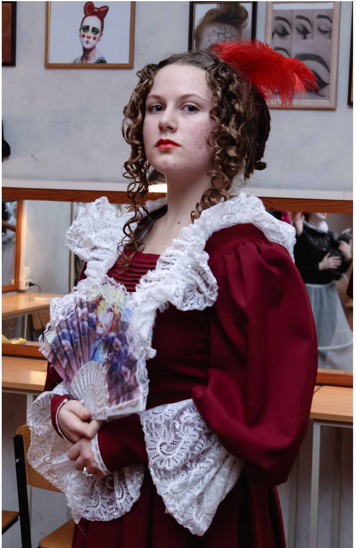
Тема . Сказочный грим