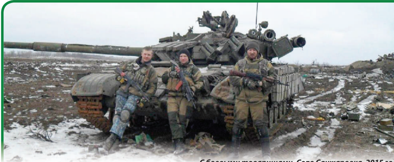
С боевыми товарищами. Село Санжаровка, 2015 год