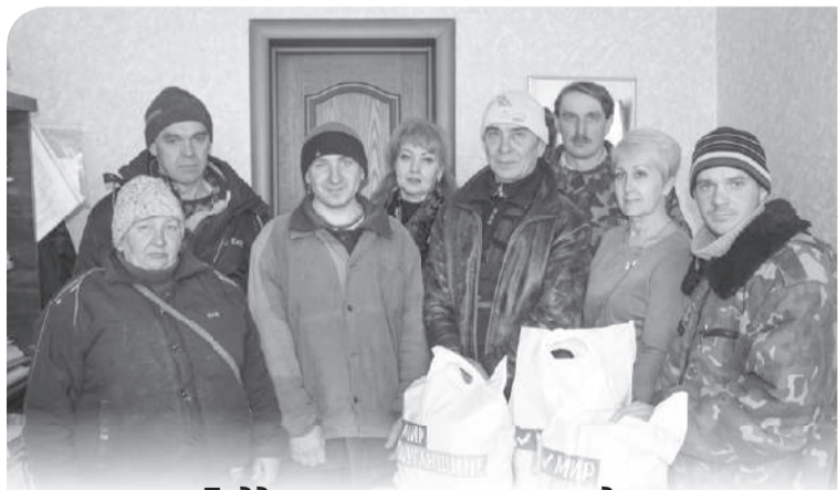
Поддерживаем тех, кто нуждается в помощи

– Если коротко, людьми и взаимодействием. Теротделение живёт чаяниями жителей района, их радостями и горестями, праздниками и буднями, проблемами и перспективами. Наша деятельность направлена во благо людей. Но без взаимодействия с администрацией района, отделами по обеспечению жизнедеятельности, Республиканским исполнительным