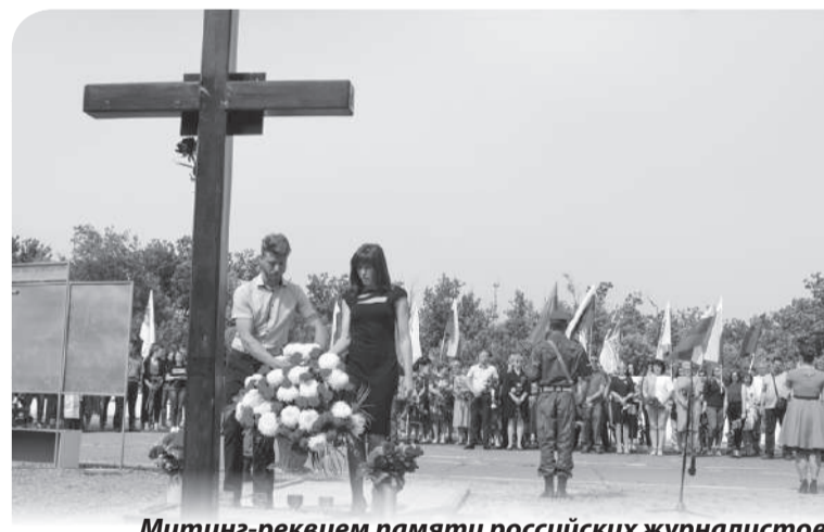
Митинг-реквием памяти российских журналистов

– Депутаты – это наша поддержка и опора. За районом закреплены три депутата Народного Совета ЛНР от Общественного движения «Мир Луганщине» –