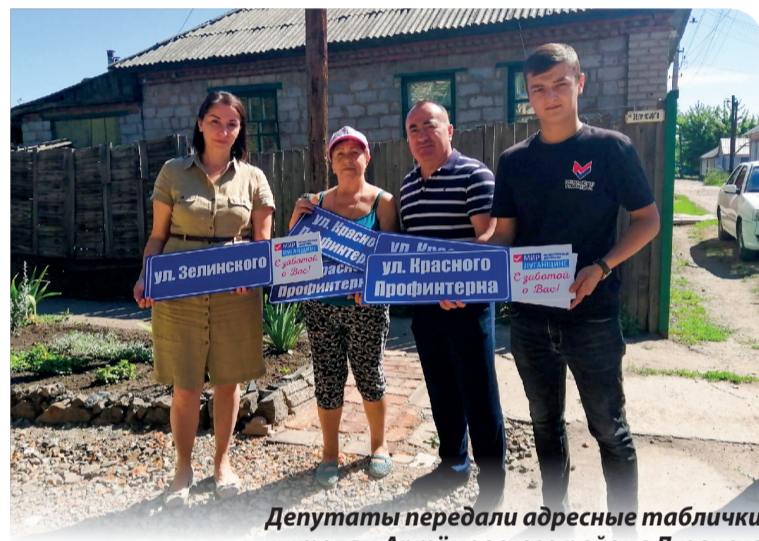
Депутаты передали адресные таблички жителям Артёмовского района Луганска

Вступительная кампания показала, что сегодня значительно возрос интерес абитуриентов и их родителей к педагогическим специальностям. В этом году по педагогическим направлениям подготовки осуществлялся набор по 38 образовательным программам. Луганский государственный педагогический университет в процессе оптимизации стал информацион-