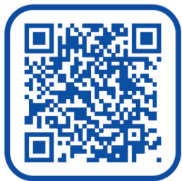
Прогноз магнитных бурь на май

ЭЛЕКТРОННАЯ ВЕРСИЯ ГАЗЕТЫ «МИР ЛУГАНЩИНЕ»