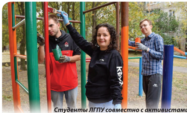
Студенты ЛГПУ совместно с активистами восстановили спортивную площадку

Мы пытаемся работать достаточно активно несмотря на те социально-экономические и эпидемиологические условия, которые сейчас существуют.