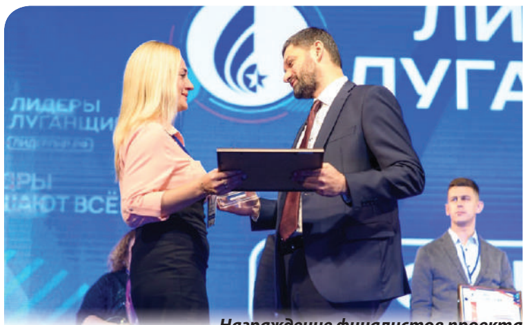
Награждение финалистов проекта «Лидеры Луганщины», 2019 год

в свое время законодательство Российской Федерации, заинтересовалась накопительной пенсионной системой. И когда ознакомилась с требованиями к участию в проекте, решила в рамках проекта внести предложение о пенсионной реформе.