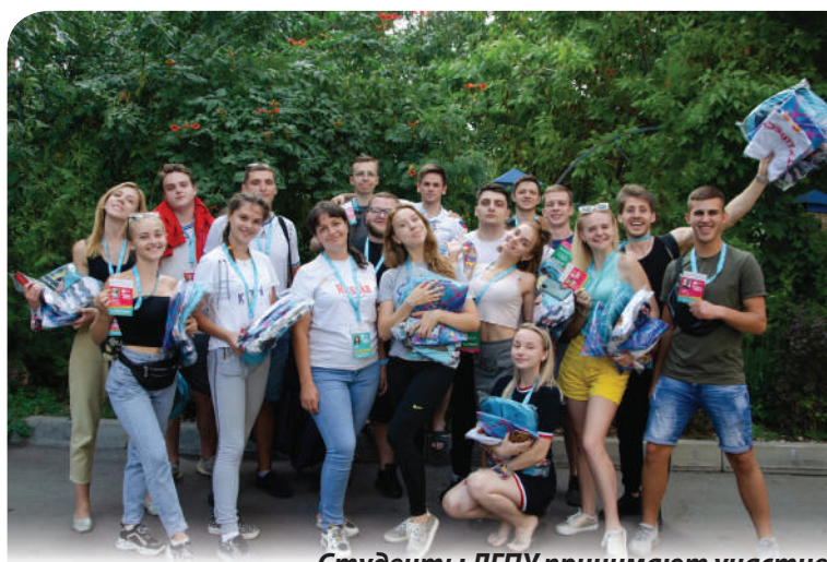
Студенты ЛГПУ принимают участие в фестивале «Российская студенческая весна»