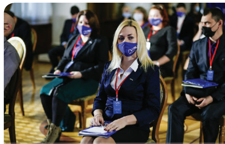
Форум #GYRU проекта «Лидеры Луганщины», 2020 год