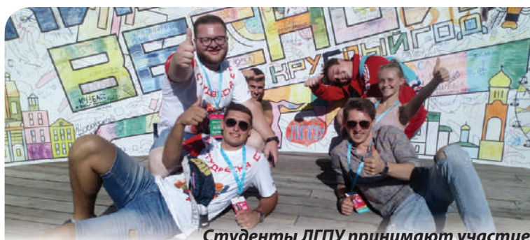
Студенты ЛГПУ принимают участие в фестивале «Российская студенческая весна»