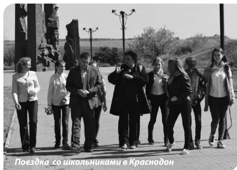
Поездка со школьниками в Краснодон

Какие у вас впечатления о самом конкурсе?