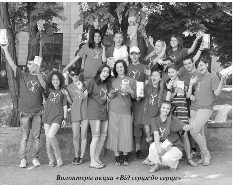
Волонтеры акции «Від серця до серця»