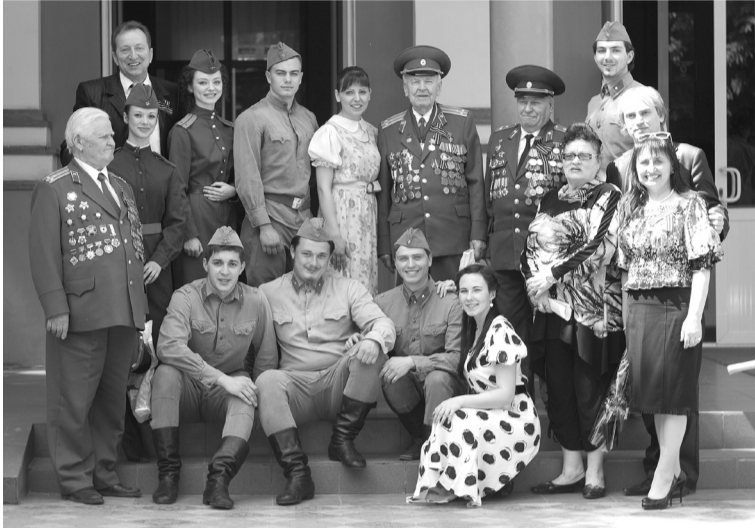
Актеры 4 курса и их преподаватели — с ветеранами

3 мая для студентов академии в рамках деятельности Центра толерантности был организован показ художественного фильма «Брестская крепость». Фильм рассказывает о героической обороне Брестской крепости, которая