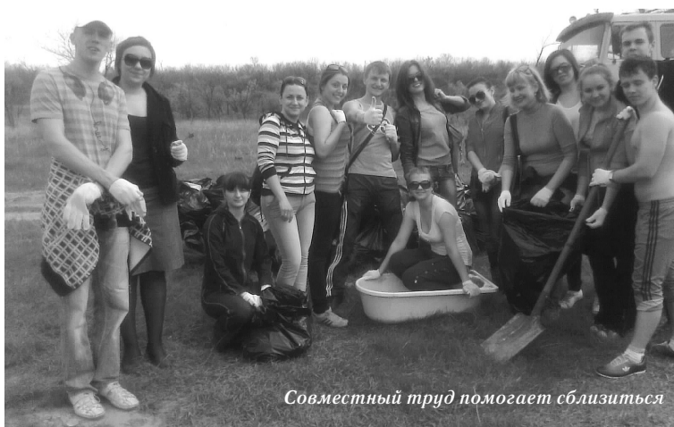
Совместный труд помогает сблизиться

ходить по чистой земле, дышать чистым воздухом, безгранично наслаждаясь всеми дарами природы! И хотя мы знали с ребятами друга друга уже целый год, а с некоторыми были знакомы и ещё раньше, каждый из них открылся для меня совершенно по-новому! Убирая территорию, это памятное место, сердце каждого открылось добру, очистилась душа каждого. Мы помогли не только матушке-природе, мы не только почтили память погибших, мы помогли друг другу и самим себе стать лучше!