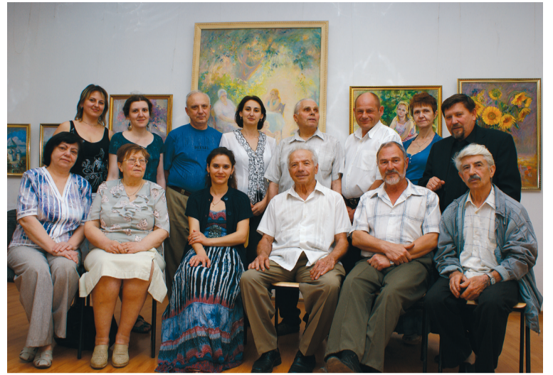
Художественная элита Луганска

Зачастую, отдельные произведения современного авангардного искусства отвлечены от вечных ценностей и даже повседневной жизни, быта, в них выражены поиски максимальной творческой свободы. Мне же хотелось пока-