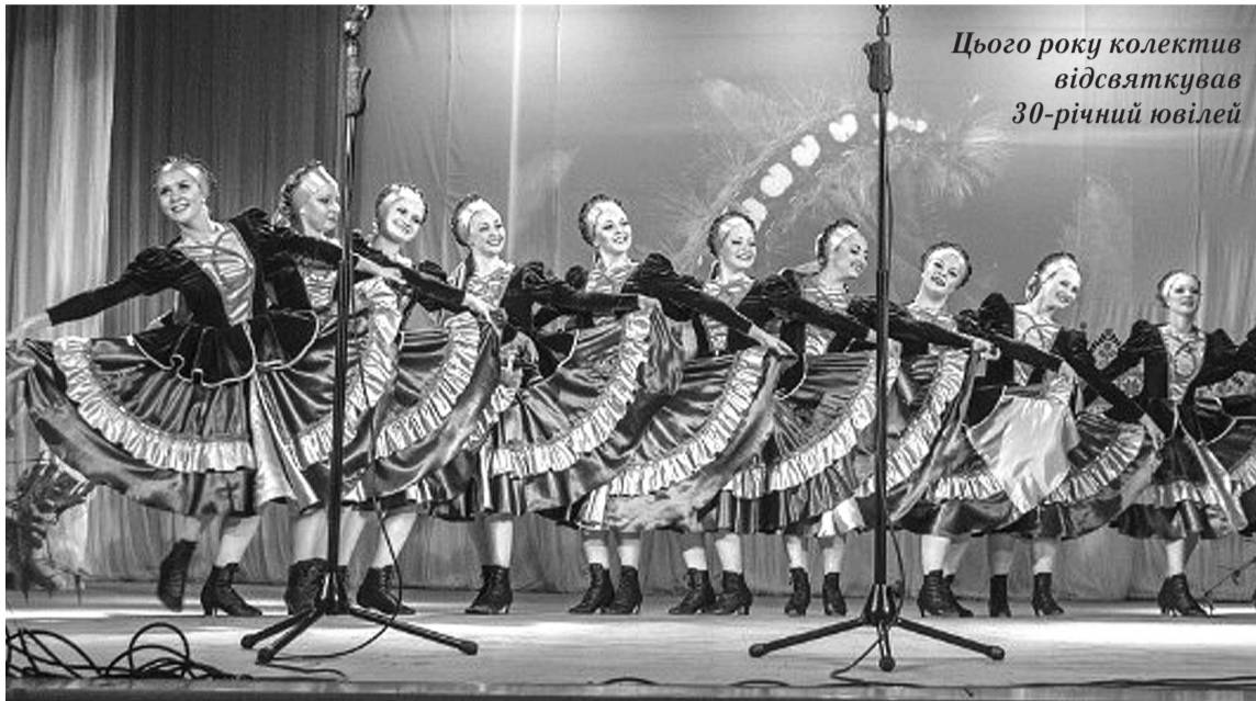
Цього року колектив відсвяткував 30-річний ювілей

Системная ошибка. FATAL ERROR. Никто не смеет лезть В мой еждневный спор, Никто не смеет думать, Никто не смеет ждать, Никто уже не знает конечный результат. Цепочкой сбитых целей прикручен кислород. Жаль, но не цели эти Влияют на исход, Жаль, но не в жизни этой Обрадует рассвет, Цепочка сбитых целей, но главной цели нет. Фантомы нужных действий, иллюзии преград. Поступок за поступком, Жизнь катится назад, На дно по нисходящей, Над пропастью во ржи, Цепочка за цепочкой, отчаянный режим. В занятии мелочами пройдёт секунда-жизнь. Без смысла и пощады, Без правды или лжи, Без главного решения Оставлен вечный спор, Системная ошибка. FATAL ERROR.