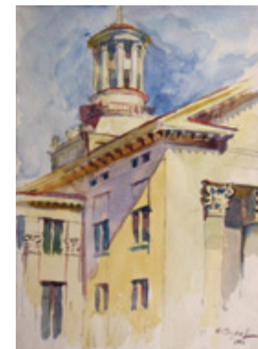
«Дом техники» бумага, акварель