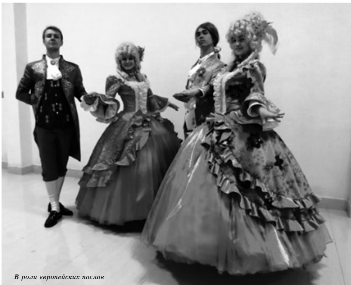
В роли европейских послов