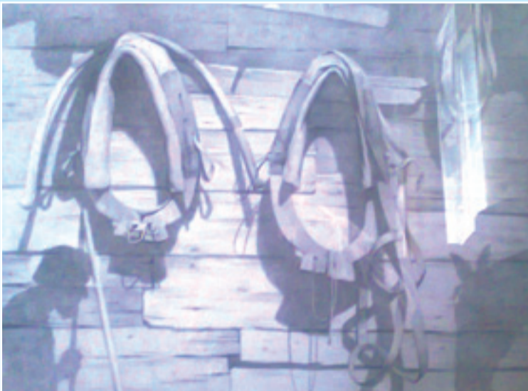
«Хомуты» бумага, карандаш

С каждым днем, окруженный вниманием педагогов и настроенный бороться с ленью, я и стал действительно создавать и творить ”