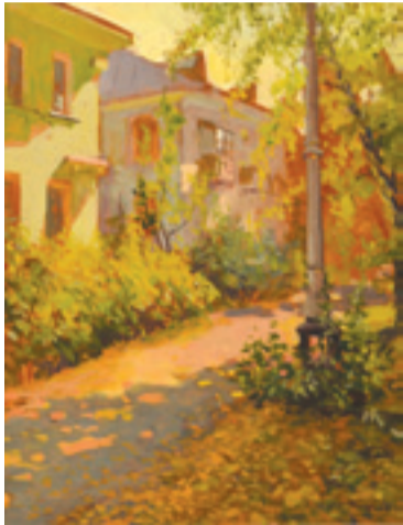
«Осенний двор» картон, масло.

— Принцип был очень прост: выбрать лучшие работы из разных направлений (постановочные, пленэрные и твор-