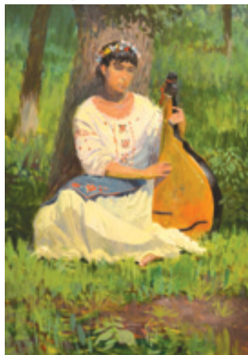
«Бандуристка» картон, масло.

Причем данные воспоминания могут быть как плохими, так и хорошими.